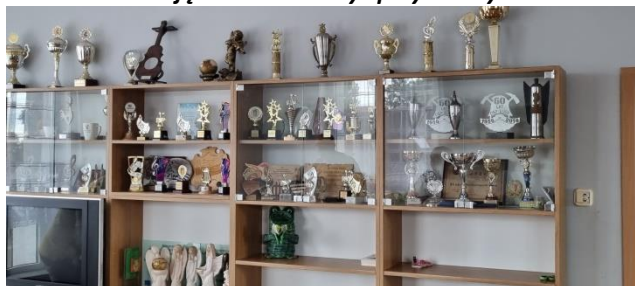
Zdjęcie nr 20 – Aktywność sołectwa – ściana pucharowa