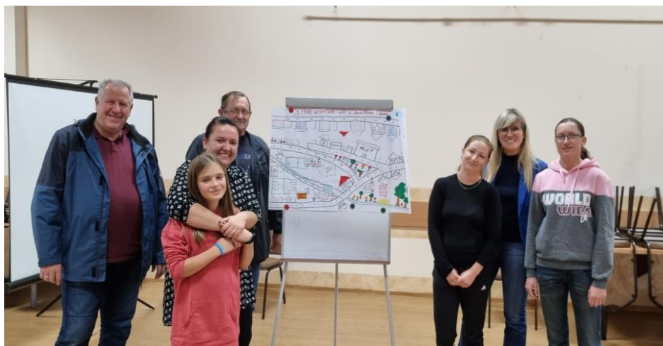
Zdjęcie 20 Prezentacja wizji obrazkowej miejscowości