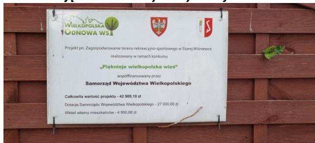
Zdjęcie nr 21 – Tablica promocyjna – dofinansowanie WOW