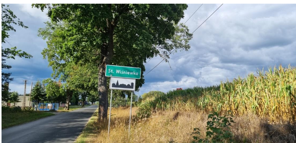
Zdjęcie nr 1 – Wjazd do miejscowości