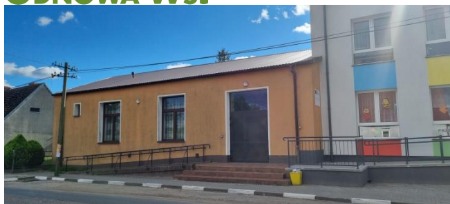
Zdjęcie nr 8 – Sala wiejska w miejscowości