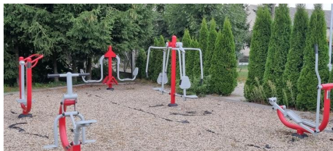
Zdjęcie nr 11 – Siłownia zewnętrzna