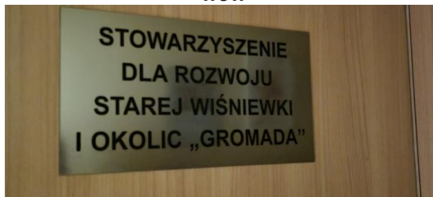
Zdjęcie nr 23 – Siedziba Stowarzyszenie dla rozwoju miejscowości