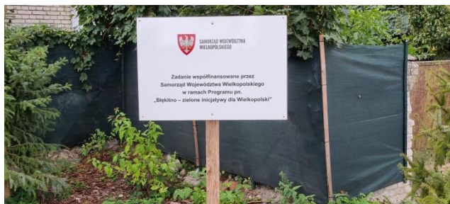
Zdjęcie nr 22 – Tablica promocyjna – dofinansowanie UMWW