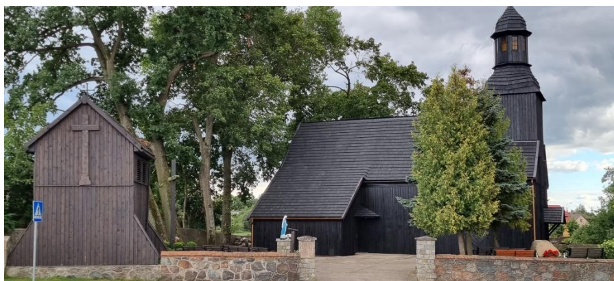
Zdjęcie nr 5 –Centralny punkt w miejscowości – ZABYTKOWY KOŚCIÓŁ KLASY O

Administracyjnie wieś należy do sołectwa o tej samej nazwie. Graniczy z 4 sołectwami (Czernice, Ługi, Prochy, Nowa Wiśniewka). Centrum wsi rozciąga się wzdłuż drogi powiatowej nr 1022P (Prusinowo) – granica woj. pomorskiego – Trudna – Łąkie – St. Wiśniewka – Złotów (dr nr 188). Wieś położona jest w odległości 7 km od Zakrzewa – siedziby Gminy i 12 km od Złotowa - siedziby Powiatu. Stara Wiśniewka jest drugą, co do wielkości i najstarszą wsią w Gminie Zakrzewo.