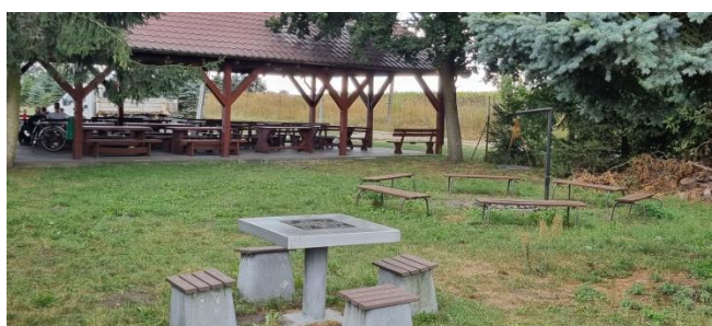
Zdjęcie nr 12 – Wiata rekreacyjna, szachy zewnętrzne