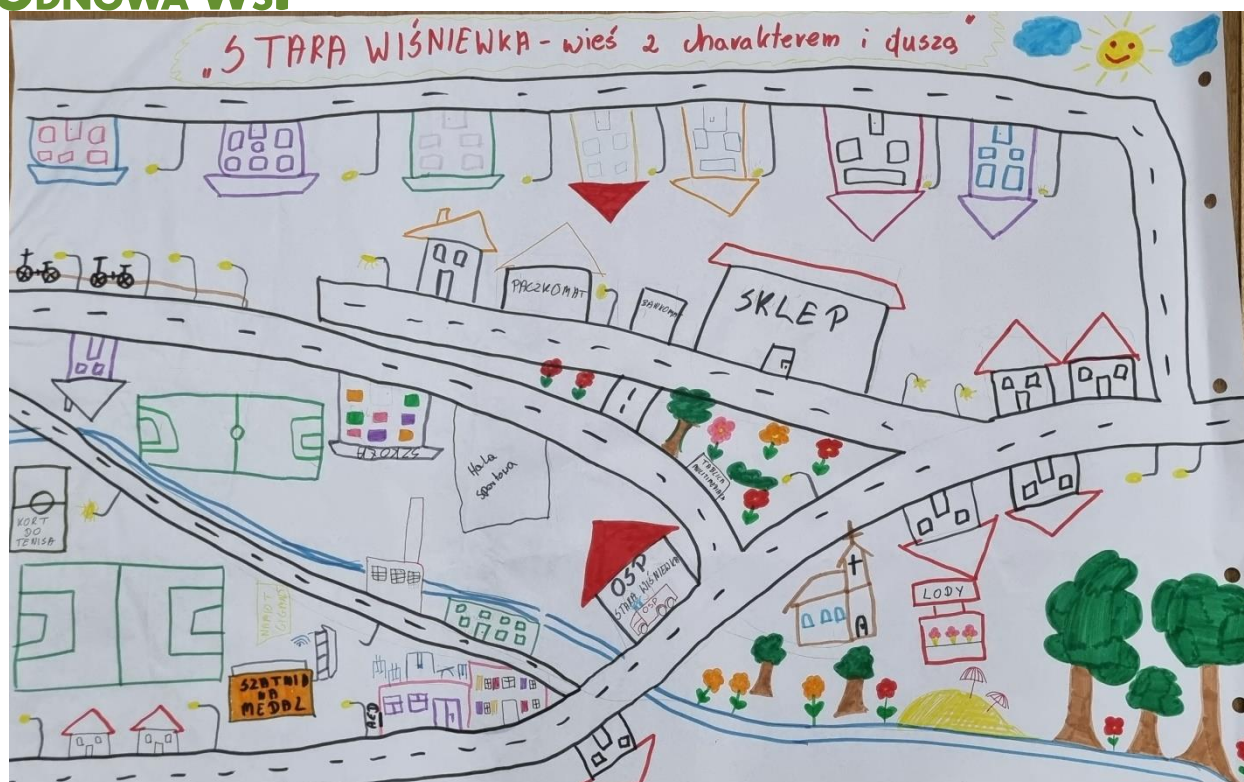
Zdjęcie 21 Wizja obrazkowa miejscowości wykonana podczas warsztatów przez Przedstawicieli GOW