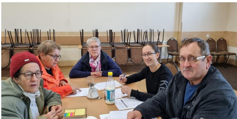
Zdjęcie nr 3 – Praca grupy podczas pierwszego dnia warsztatów

Pierwszego dnia warsztatów członkowie grupy pracowali nad określeniem analizy zasobów . Na podstawie tego dokumentu wskazywali elementy, które oceniają jako silne strony sołectwa i słabe – wymagające zmiany. Wskazywali również na to, jakie szanse i zagrożenia płyną z otoczenia zewnętrznego, które mogą zostać wykorzystane lub ograniczać rozwój sołectwa. W ten sposób przeprowadzono analizę SWOT - analizę, która identyfikuje i wskazuje silne i słabe strony sołectwa, oraz szanse i zagrożenia jakie mają oddziaływanie na sołectwo. Analiza ta uwzględniała poprzedni dokument, który obecnie uległ modyfikacji ze względu na realizację wcześniej zaplanowanych zadań i powstałych nowych oczekiwań mieszkańców do sytuacji panującej obecnie w sołectwie. Każda z wykazanych, obecnie występujących cech, została przypisana do jednego z obszarów potencjału rozwojowego. Są to: Standard życia, Jakość życia, Tożsamość wsi i wartości życia wiejskiego, a także Byt. Uczestnicy warsztatów przeprowadzili również analizę potencjału rozwojowego . Pozwoliło to wskazać najważniejsze cele ogólne oraz zaplanować rozwój tak, aby był on równomierny i wykorzystywał wszystkie obszary interwencji. Finalnie Grupa Odnowy Wsi wskazała wizję hasłową i wizję opisową sołectwa.