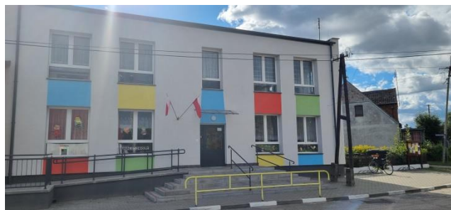
Zdjęcie nr 9 – Świetlica, biblioteka, oddział przedszkolny