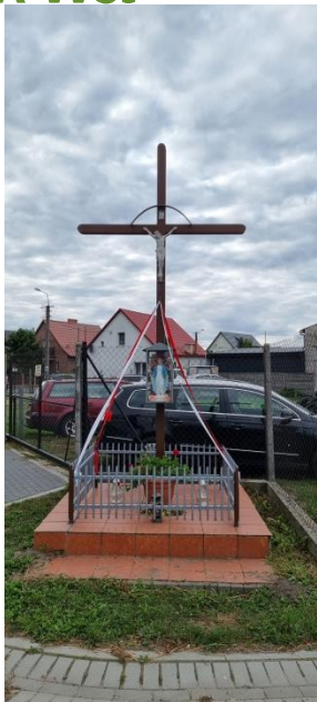
Zdjęcie nr 18 – Krzyż przydrożny