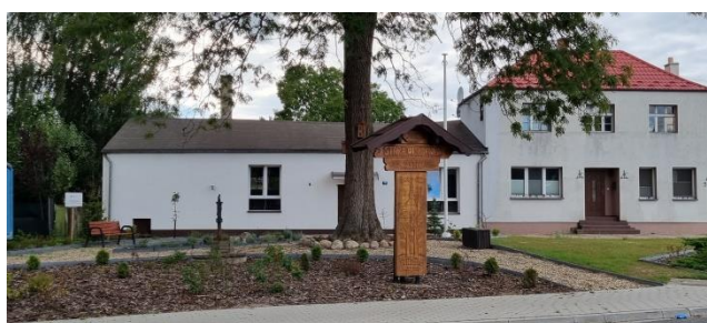
Zdjęcie nr 14 – Witacz miejscowości i sala sportowa.