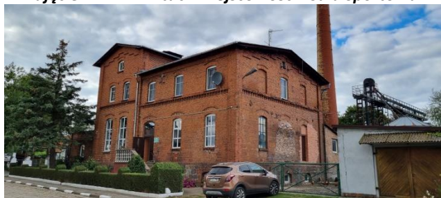
Zdjęcie nr 16 – Fasada zabytkowego budynku