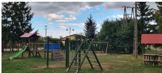
Zdjęcie nr 10 – Plac zabaw