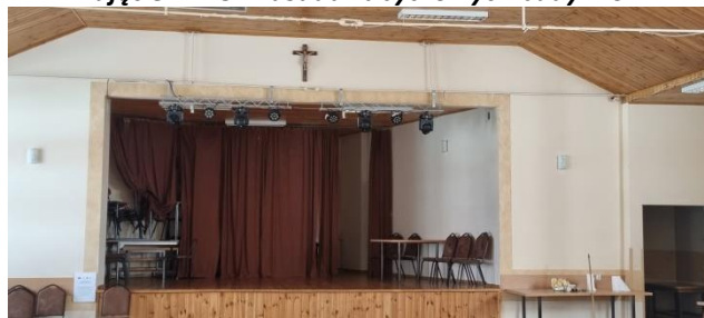
Zdjęcie nr 17 – Wnętrze sali wiejskiej