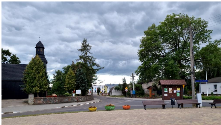
Zdjęcie nr 6 – Centrum miejscowości – zbudowane na planie tzw. owalnicy

Stara Wiśniewka tworzy wyraźnie zurbanizowaną strukturę przestrzenną. Historyczny układ przestrzenny wsi utworzony został przez trzy trakty tworzące owalnicę. Pierwotnie w owalnicy istniał najprawdopodobniej staw lub większy zbiornik wodny. Centralną budowlą wsi jest kościół.