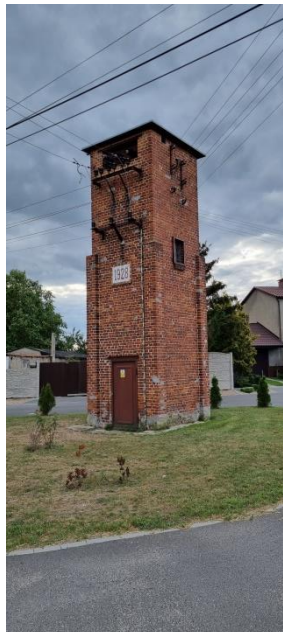
Zdjęcie nr 19 – Zabytkowy transformator