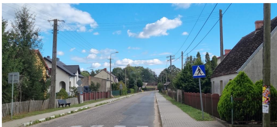
Zdjęcie nr 2 – Droga dojazdowa do miejscowości

Opracowanie Sołeckiej Strategii Rozwoju było skutkiem przeprowadzenia dwudniowych warsztatów , które poprzedzone zostały wizytacją miejscowości przez moderatorów.