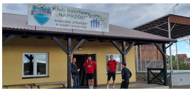
Zdjęcie nr 13 – Budynek socjalny Klubu Sportowego