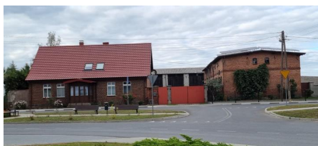
Zdjęcie nr 15 – Fasada zabytkowych budynków