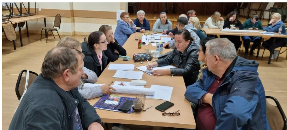
Zdjęcie nr 4 – Praca grupy podczas drugiego dnia warsztatów